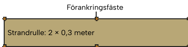
Figur 2: Generella rekommendationer för förankringspunkter. Artikelnr: 9-12035, mått: 50 cm Artikelnr: 9-12036, mått: 70 cm